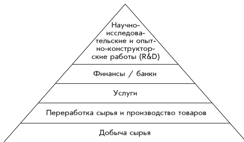
Рис. 1. Иерархия видов экономической деятельности в зависимости от доли добавленной стоимости в общей стоимости продукта

Каждый из этих видов деятельности имеет свои особенности размещения в пространстве планеты. Добывающая промышленность строго географически локализована, добывающие предприятия «привязаны» к источникам сырья. Следует особо отметить, что в контексте глобализированной экономики речь идет о добыче ресурсов не для собственного внутривосточного потребления, а для последующего экспорта за рубеж. Доходы от добывающей деятельности концентрируются у добывающих компаний, и в зависимости от того, в какой стране зарегистрированы